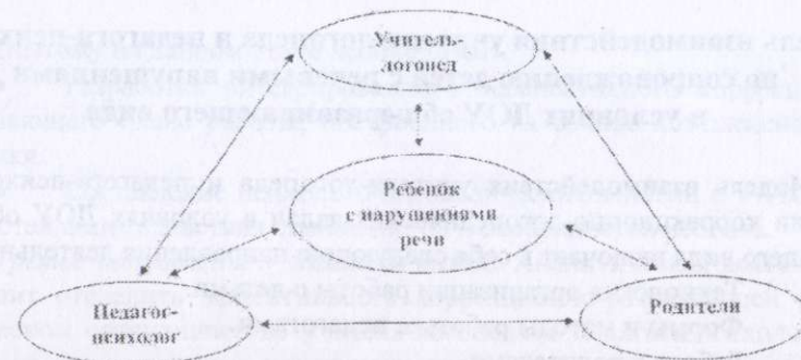
Схема взаимодействия специалистов при работе с ребенком, имеющим нарушения речи, составлена на основе схемы О. А. Степановой [14, с. 15].

В центре модели – ребенок. Воздействие на его развитие осуществляется с четырех сторон. Основное воздействие оказывают родители, поскольку именно они несут главную ответственность за воспитание и развитие своего ребенка. Активными помощниками в повышении родительской компетентности, проведении разработанных специалистами коррекционно-развивающих мероприятий с детьми являются воспитатели.